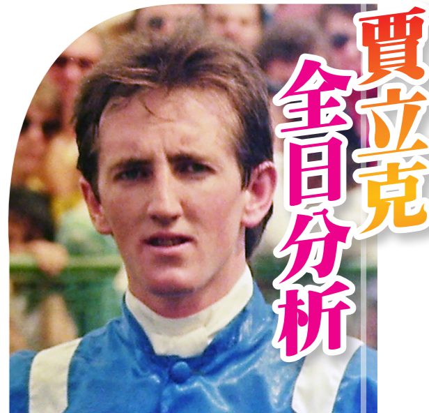
澳洲騎師賈立克曾勝出30場一級賽，包括策騎「at talaq」和「請放鬆」...